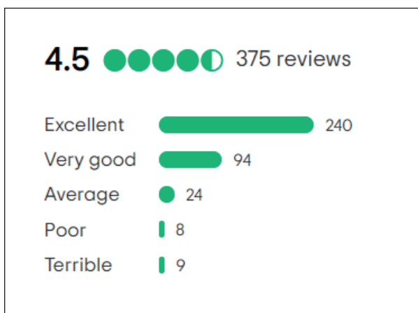
Ryc. 3. Zrzut ekranu z ogólną oceną Muzeum w Łąncucie ze strony tripadvisor.com

Zamek w Łąncucie oraz Pałac w Przeworsku widnieją na stronie Tripadvisor, mają strony na Facebooku i wspomniane są na różnych polskich blogach. Jest jednak zdecydowana różnica w liczbie tych opinii. Jeśli chodzi o stronę internetową Tripadvisor, Zamek w Łąncucie posiada 375 recenzji, których średnia ocena wynosi 4,5 (rycina 3). Natomiast w przypadku Pałacu w Przeworsku są to tylko 2 recenzje, obie o średniej 4.0 (rycina 4).