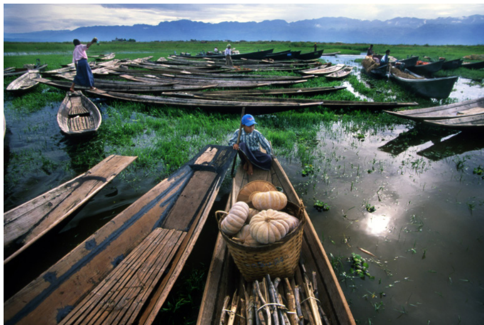
Ryc. 3. Targ wodny na Jeziorze Inle w Myanmarze