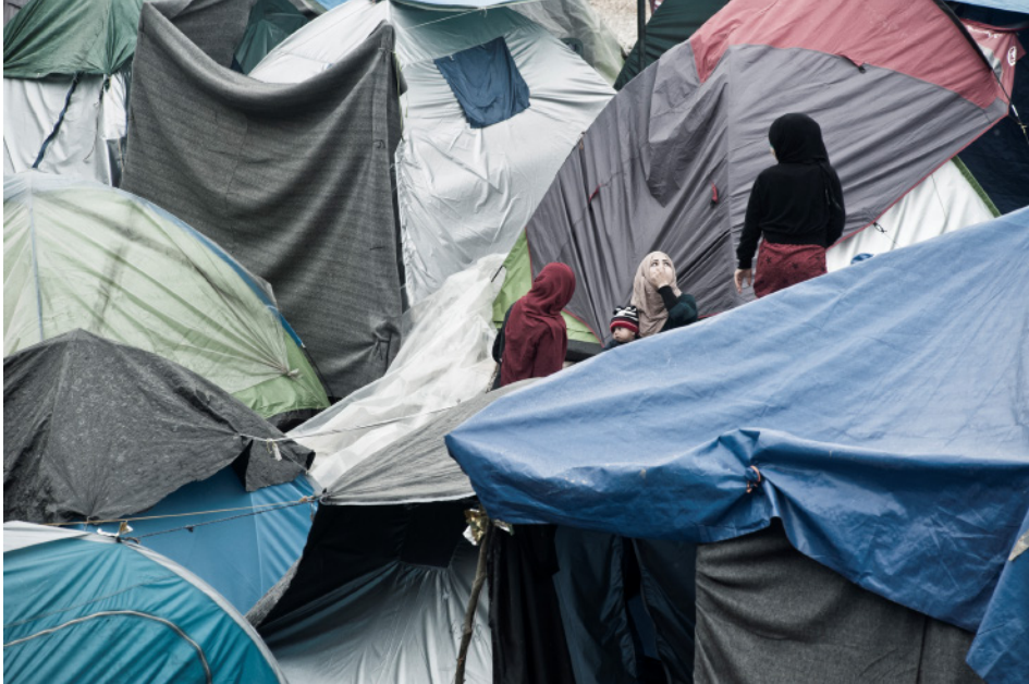
Ryc. 4. Obozowisko uchodźców w miejscowości Idomeni, Grecja

Zadaniem nauczyciela jest: trafny dobór materiałów fotograficznych; skuteczne kierowanie pracą uczniów; zwrócenie uwagi uczniów na mnogość możliwych interpretacji jednego zdjęcia.