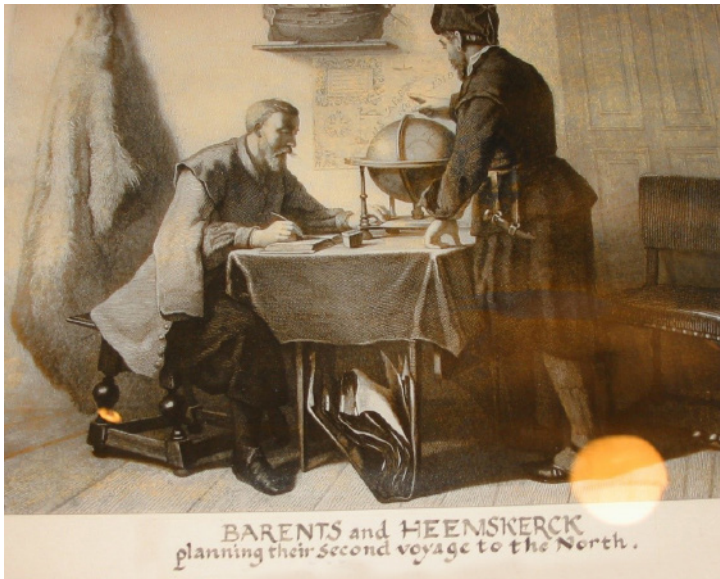
Ryc. 2. Barents i Heemskerck planują II wyprawę w rejony północne