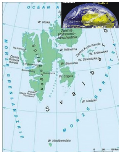
Ryc. 1. Położenie Svalbardu