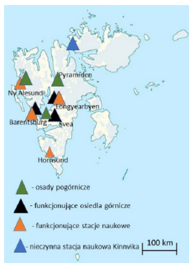
Ryc. 4. Lokalizacja osad górniczych i wybranych stacji naukowych