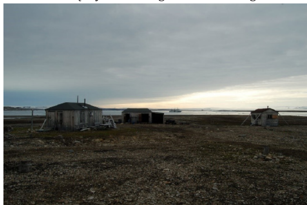
Ryc. 5. Zabudowania fińsko-szwedzkiej stacji polarnej Kinnvika

Ziemia Północno-Wschodnia (Nordaustlandet) stanowi najbardziej na północ wysuniętą część archipelagu Svalbard, sięgając 80°N. Obszar ten jest stosunkowo słabo poznany przez naukowców, ze względu na ekstremalne warunki pogodowe (szczególnie podczas nocy polarnej) oraz słabo rozwiniętą infrastrukturę. Jedynymi elementami sieci osadniczej jest kompleks zabudowań stacji polarnej Kinnvika (ryc. 4), zlokalizowanej nad fiordem Murchinson. Zabudowania te powstały w 1957 r., podczas Międzynarodowego Roku Geofizycznego. Stacja została założona przez Szwedów, Finów i Szwajcarów (ryc. 5). Do chwili obecnej zabudowania zachowały się w dobrym stanie (głównie ze względu na panujące surowe warunki klimatyczne) i stacja została reaktywowana dla potrzeb badań prowadzonych w ramach Międzynarodowego Roku Polarnego 2007–2009.