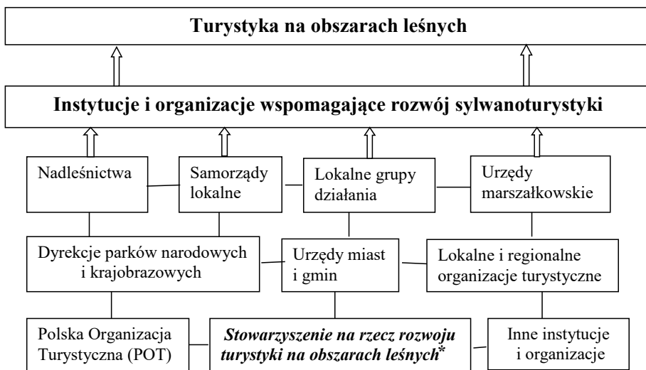
Ryc 1. Rodzaje instytucji i organizacji wspomagających rozwój sylwanoturystyki

Instytucje i organizacje uczestniczą w podejmowaniu decyzji dotyczących organizacji, funkcjonowania i rozwoju infrastruktury technicznej i społecznej. Działalność turystyczną na obszarach leśnych w Polsce wspierają lub mogą wspierać różne instytucje i organizacje