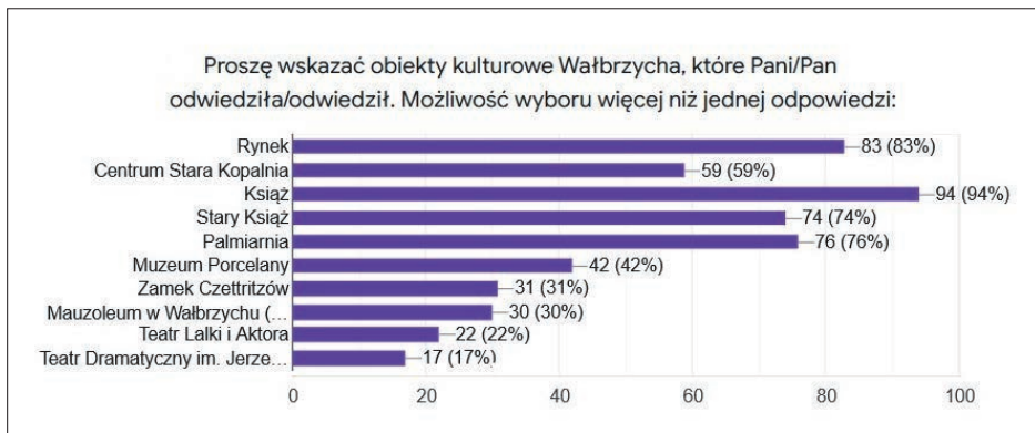
Ryc. 3. Obiekty kulturowe w Wałbrzychu wskazane przez respondentów

Źródło: opracowanie własne na podstawie Google Forms