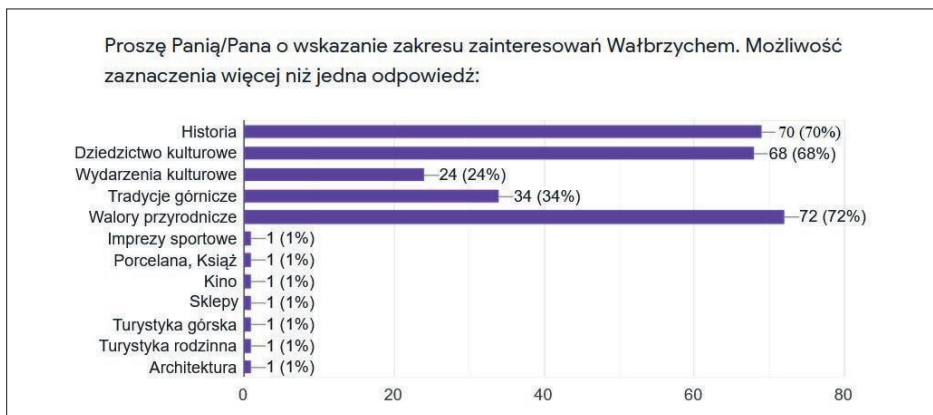
Ryc. 2. Zakres zainteresowania Wałbrzychem wśród respondentów