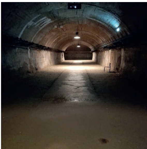
Fot. 2. Podziemny tunel na poziomie 50 m pod dziedzińcem Książa