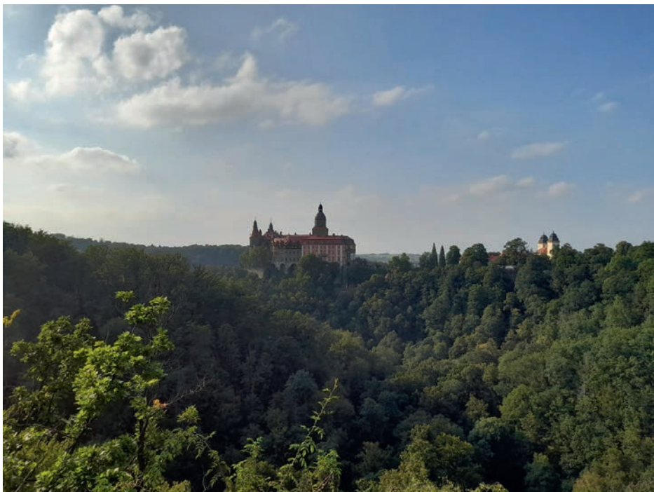
Fot. 1. Widok na Książ z punktu widokowego w Książańskim Parku Krajobrazowym