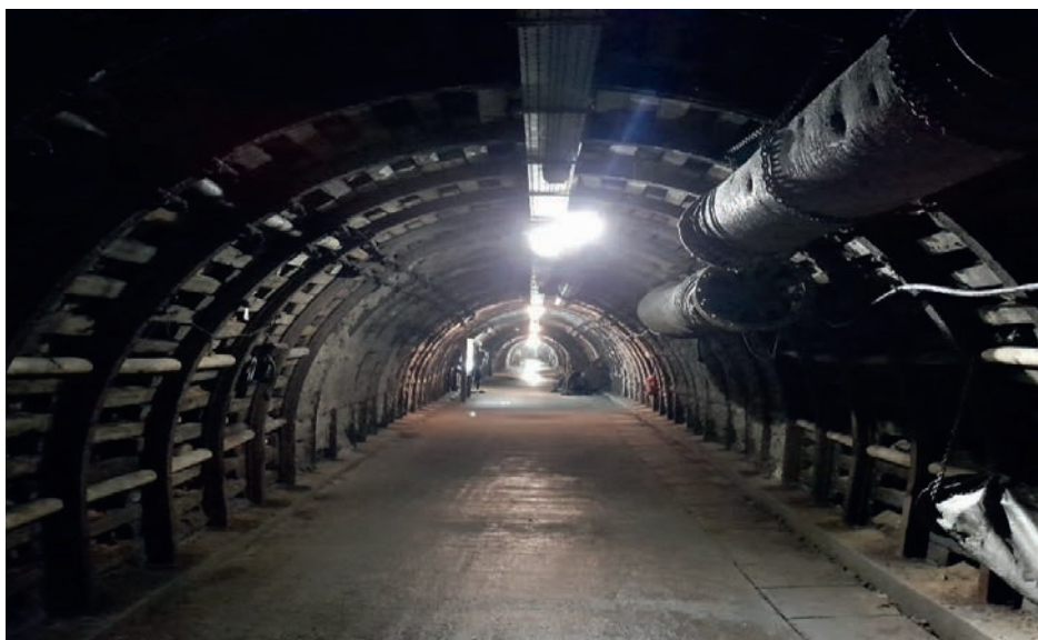
Fot. 3. Trasa podziemia w Parku Wielokulturowym Stara Kopalnia – Centrum Nauki i Sztuki

Innym bardzo interesującym obiektem jest Park Wielokulturowy Stara Kopalnia – Centrum Nauki i Sztuki, który został utworzony w miejscu Muzeum Przemysłu i Techniki, na terenie KWK „Julia”. Obiekt otwarto 9 listopada 2014 r. (Lisowska 2016; Augustyn 2019). Jest to zarazem przykład miejsca, gdzie dawną funkcję przemysłową zastąpiła funkcja turystyczna. W Starej Kopalni można zobaczyć min. szatnię łańcuszkową, odzież roboczą, mundury, czaka górnicze, medale, sztandary, mapy, maszyny górnicze, narzędzia górnicze, aparaty tlenowe, makietę Lisiej Sztolni (Augustyn 2019). Zwiedzanie obiektu obejmuje przejście trasą podziemną (Fot. 3). Przewodnicy w Starej Kopalni to dawni górnicy KWK „Julia” (Lisowska 2016). Odbywa się tam wiele wydarzeń min. Festiwal Tradycji Górniczych Barbórka, który został wyróżniony tytułem „Turystycznego Produktu